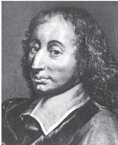
BLAISE PASCAL (1623-1662)